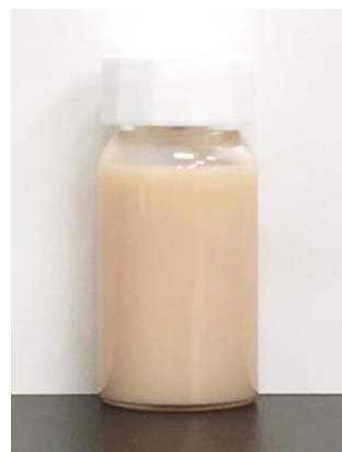
α-トコフェロール乳剤23%