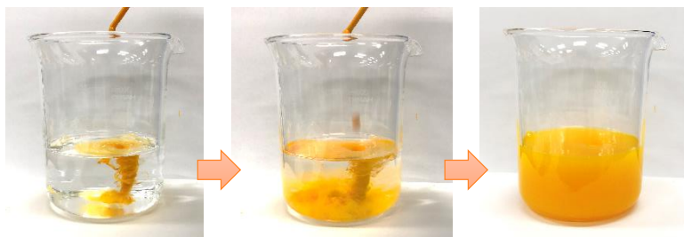
クルクミン水分散液35%の希釈状態