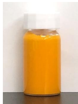
クルクミン水分散液35%